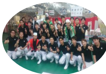
（昨年度の感謝祭から）