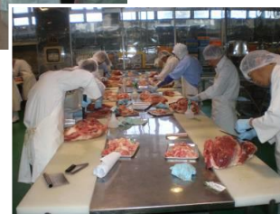
カット実習で実体験!!