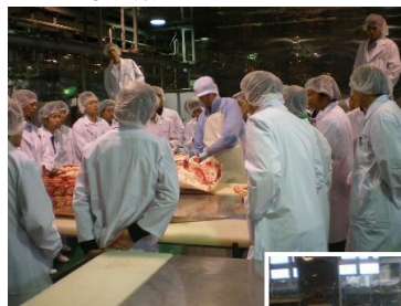
専任講師によるデモカット